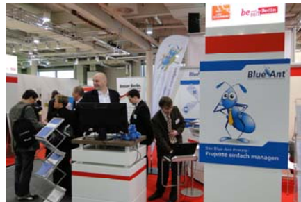
CeBIT Stand der proventis GmbH